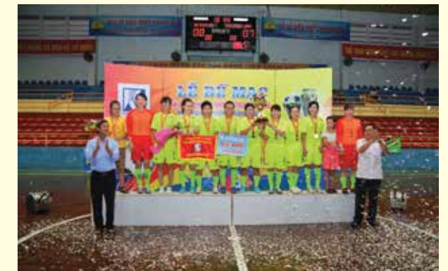
Giải nhất nữ: Nhà máy Thuốc lá Khatoco Khánh Hòa