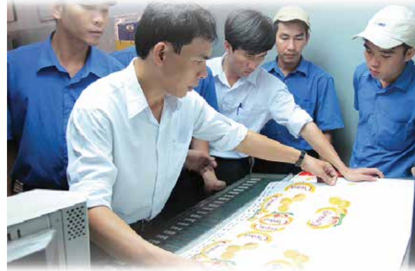
Đào tạo tay nghề công nhân.