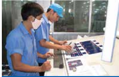
Kiểm soát chất lượng trong quá trình sản xuất.