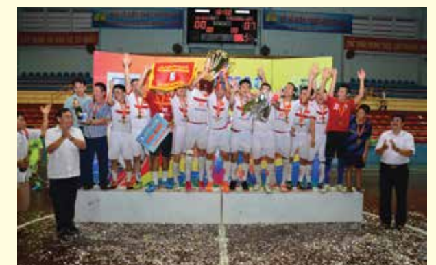
Giải nhất nam: Công ty TNHH Thương mại Khatoco