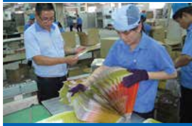
Kiểm tra thành phẩm trước khi đóng gói.

“Không có thương hiệu mạnh nếu như không có sản phẩm tốt” - vì vậy trong nhiều giai đoạn suy thoái kinh tế hay sự xuất hiện liên tục của những đối thủ cạnh tranh cũng không làm suy yếu hay ảnh hưởng nhiều đến những thương hiệu khổng lồ trên thế giới.