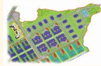
Kiến trúc cảnh quan Cụm công nghiệp Trảng É 1

Trong lĩnh vực bao bì, sản phẩm của nhà sản xuất bao bì lại là vật tư - (Xem tiếp trang 7)