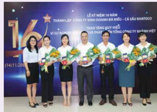
Công ty Kinh doanh Đà điều - Cá sấu Khatoco nơi gắn bó của bao thế hệ

Cũng như các thành viên khác trong đại gia đình Khatoco, công ty Kinh doanh Đà điều - Cá sấu Khatoco trở thành nơi gắn bó của nhiều thế hệ. Qua bao năm tháng, họ cùng cống hiến tuổi xuân, cùng nhau trưởng thành và phát triển. Thời gian làm việc được tính bằng năm: 1 năm, 5 năm, 10 năm, 15 năm và sẽ hơn thế nữa!