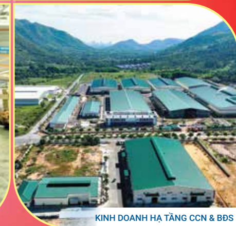
KINH DOANH HẠ TẦNG CCN & BDS