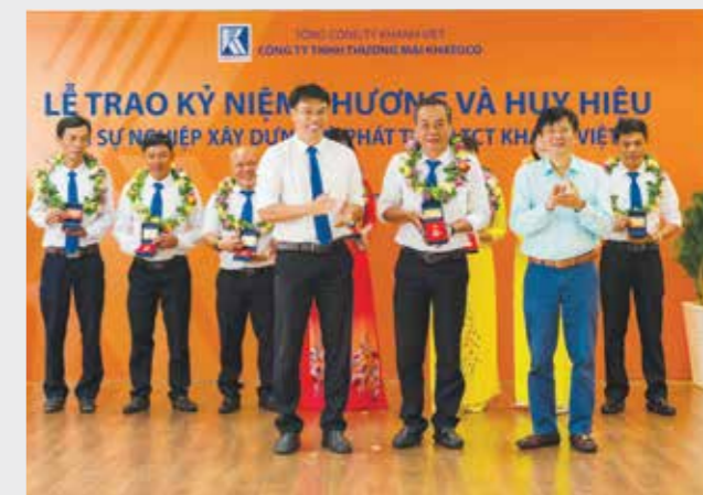
Trao tặng Huy hiệu Khatoco cho người lao động

Bước sang năm 2023, nhằm phát huy những thành quả đã đạt