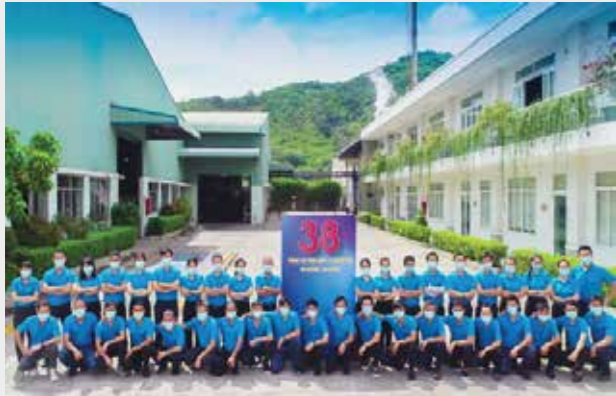
Tập thể Dopack luôn với tinh thần Đoàn kết là sức mạnh

“Tự hào thay Khatoco yêu dấu Qua bao tháng ngày ta chung sức dựng xây”