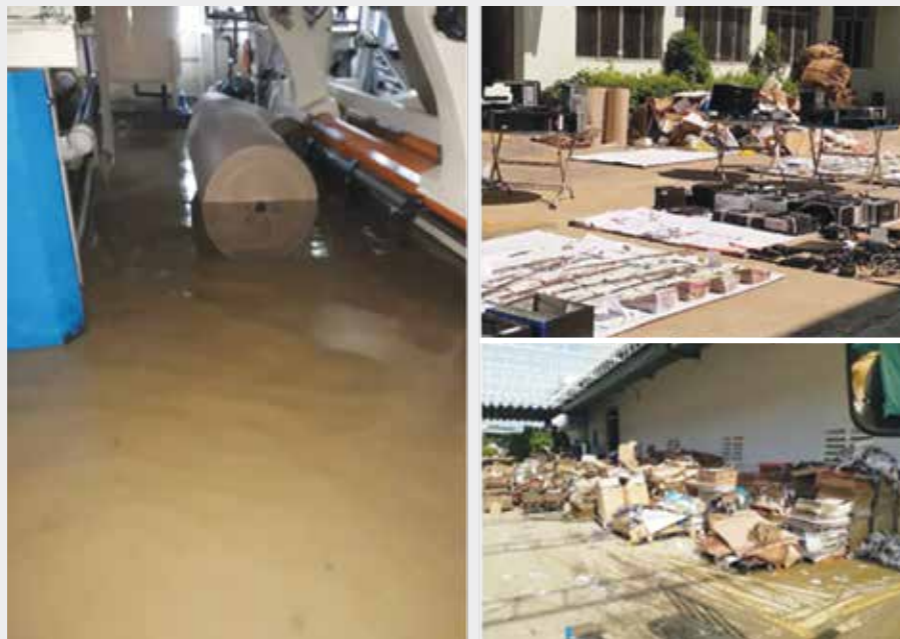
Bão lụt 2018

Những thách thức đặt ra chính là cơ hội để Khatoco thử lửa về sức khỏe, độ bền và khả năng ứng phó trong giai đoạn khó khăn nhất, đã cho thấy sự đoàn kết, quyết tâm, kỷ luật, kiên định hơn bao giờ hết của toàn thể người lao động. Và nếu không có sức mạnh đoàn kết,