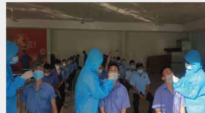
Trích nhật ký 3 tại chỗ

sự gắn bó và cống hiến hết sức mình của người lao động thì chắc chắn không có Khatoco ngày hôm nay.