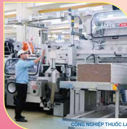
CÔNG NGHIỆP THUỐC LÁ