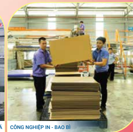
CÔNG NGHIỆP IN - BAO BÌ