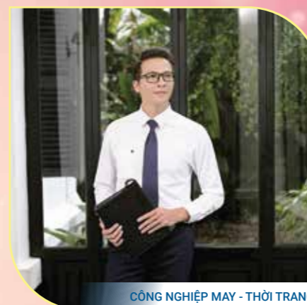
CÔNG NGHIỆP MAY - THỜI TRANG