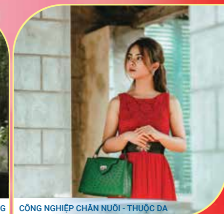
CÔNG NGHIỆP CHĂN NUÔI - THUỘC DA